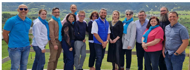
Les élu(e)s UNSA-Défense – Secrétaires généraux et nationaux